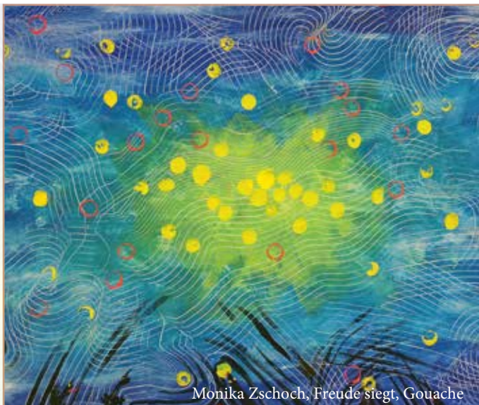
Monika Zschoch, Freude siegt, Gouache

Donnerstag, 25. Juli, 17.00 bis 18.30 Uhr im Eingangsbereich Bildergespräche: Rundgang mit beteiligten Künstler*innen